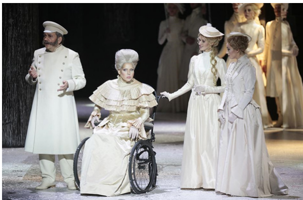
Рис. 1. Сцена из оперы «Идиот». Большой театр

чтобы лучше передать атмосферу драматизма и психологию персонажей. Весь уровень культурной драмы этой оперы состоит не только из глубины сюжета, но и из продуманности деталей, таких как эффектность декораций, язык образов и синтаксис музыки. Визуальные элементы, особенно костюмы, способствуют созданию образа главных героев, их судеб и страданий. Костюмы подчеркивают индивидуальность персонажей и создают атмосферу эпохи, в которой происходят события (рис. 1). Музыкальный спектакль стал сочетанием самобытной чувственности с глубиной образов и тонкостью переживаний героев. Опера увлекает зрителя в мир загадочной духовности, где страсть, любовь и интриги тесно переплетаются с философскими взглядами на свободу и правду. Музыкально-драматическая связь в этом произведении – вот что делает его настоящим творением искусства. Музыка, объединяющая сцены, является одновременно как ритмичным, так и мелодичным компонентом драмы, тем самым открывая на зрителей глубокую психологическую терапию. В опере используются как хоровые сцены, так и вокальные соло. Многочисленные арии, заставляют зрителя сопереживать героям и понимать их эмоциональный настрой. Большой хор создает ощущение общей пульсации интриг, и ясно открывает драматический характер событий. Рассмотрим основные музыкальные партии, которые воплощают жизнь и судьбы персонажей оперы «Идиот».