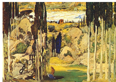
Рис. 4. Л. Бакст. Эскиз декорации к балету «Дафнис и Хлоя». Картина 1. 1912.

М.М. Фокин сконцентрировал внимание на описании нежного чувства, противостоящего всем препятствиям. При работе над балетом он тщательно изучал коллекции Эрмитажа, Музея слепков Императорской Академии художеств, альбомам, монографиям из Российской Национальной библиотеки. Хореография лишена «па» и позиций классического балета, пластика строилась на изобразительных принципах. Работа с