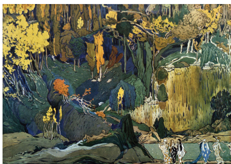
Рис. 1. Вацлав Нижинский в костюме Фавна. 1912.

стюм использовалось для балета «Нарцисс». В «Послеполуденном отдыхе фавна» В.Ф. Нижинский танцевал в тесно облегающем трико кофейного цвета из очень тонкого материала. Гирлянда из листьев бересклета опоясывала бедра и заканчивалась сзади хвостиком, что подчеркивало получеловеческое-полуживотное происхождение персонажа. Центральными для всей сценографии стали растительные мотивы и золотистые цвета, которые объединяли костюм фавна, хитоны и нимф и осенний пейзаж декораций. Античность много раз становилась предметом интереса Л.С. Бакста, он также оформил балеты «Елена Спартанская» (1912), «Федра» (1917 и 1923), «Орфей» (1914) и трагедии «Эдип в Колоне» Софокла (1904) и «Ипполит» Еврипида (1902). Историк искусства Н.А. Борисовская в книге «Лев Бакст» называет момент создания ряда костюмов к балету «Послеполуденный отдых Фавна» этапом, открывшим Баксту путь к новому экспрессионистическому балету и позволявшим художнику «перейти к новому пониманию архаики и классики, присущему уже началу XX века. <...> При работе над этим балетом Лев Бакст был увлечён созданием не просто стилизации, но оригинального пластического языка, присущего именно балету» 20 . На эту находку обращали внимание и современники, например, композитор И.Ф. Стравинский писал так: «Он [Бакст] не ограничился декоративным оформлением и созданием великолепных костюмов. Он указывал мельчайшие движения танцев» 21 .