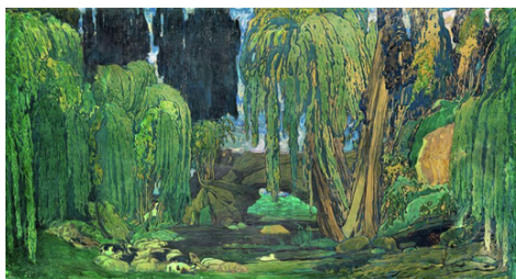
Рис. 3. Л. Бакст. Эскиз декорации к балету «Нарцисс». 1911.

Однако назвать постановку неудачной будет неверно: музыка Равеля остаётся одной из вершин наследия дягилевской антрепризы, а хореографическая и сценографическая интерпретация античного наследия оказывается настолько многослойной, что погружение в её детали само по себе становится захватывающим исследованием.